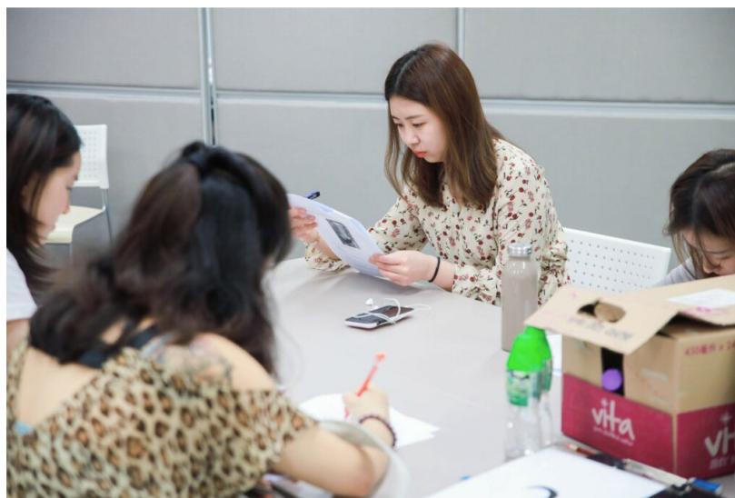
觀看後的知識測驗