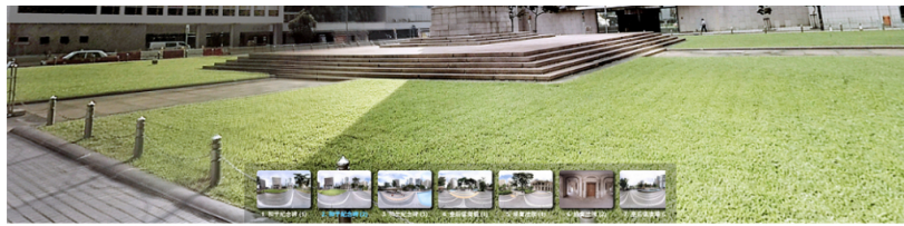
透過VR參觀和平紀念碑